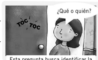
Esta pregunta busca identificar la persona, cosa, lugar o animal del que se habla.