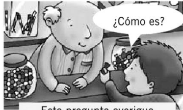
Esta pregunta averigua las características de un ser, un objeto o un lugar.