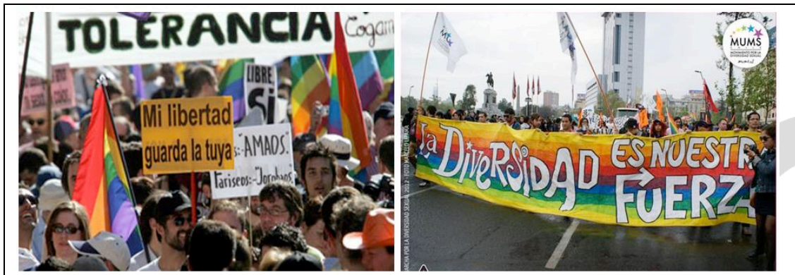
(El País, 2005 y MUMS, 2013)

Las imágenes anteriores muestran distintas manifestaciones públicas ocurridas en Madrid en 2005 y en Santiago de Chile en 2013. Esta última reivindicaba la inclusión de la diversidad social dentro de los marcos normativos que estaban vigentes en Chile en ese momento. ¿Cuál de las siguientes situaciones quedó en evidencia con el desarrollo de estas manifestaciones?