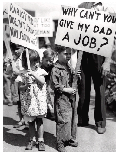
Niño sostiene cartel que dice "¿por qué no le pueden dar trabajo a mi papá?"