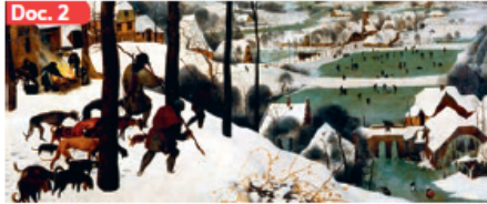
▲ Entre el siglo XIII y el siglo XIX la Tierra pasó por un largo período de enfriamiento que los científicos denominan Pequeña Edad de Hielo. Diversos pintores, han dejado testimonio de esta etapa. En la imagen, la obra Cazadores en la Nieve de Pieter Bruegel el Viejo (1565).