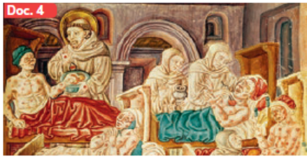
▲ Miniatura que representa a San Francisco atendiendo a enfermos de la peste negra (1477).

Los flagelantes de Tournai, Bélgica (1349). Los flagelantes constituyeron un movimiento católico radical que interpretó la crisis del siglo XIV como un castigo divino. Durante este período organizaron procesiones en las que se golpeaban con látigos y otros objetos para expiar sus pecados.