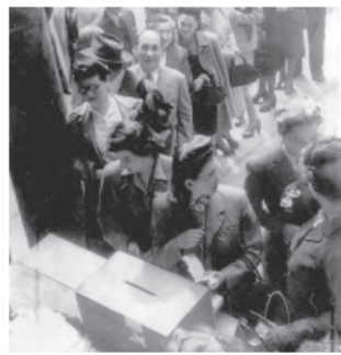
Mujeres votando en las elecciones municipales de 1945.