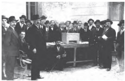
Hombres votando en la elección presidencial de 1915.