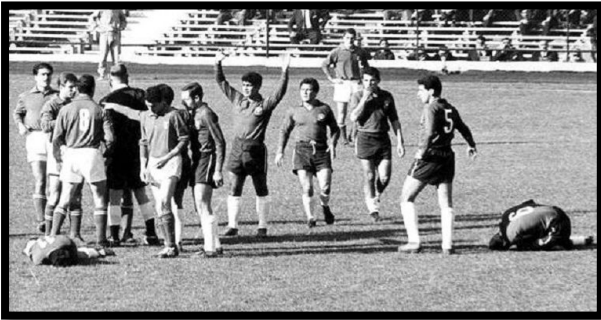
Imagen correspondiente a la transmisión en televisión abierta del Mundial de Futbol del año 1962 en Chile.

1.- Observa las siguientes imágenes y responde las preguntas señaladas: